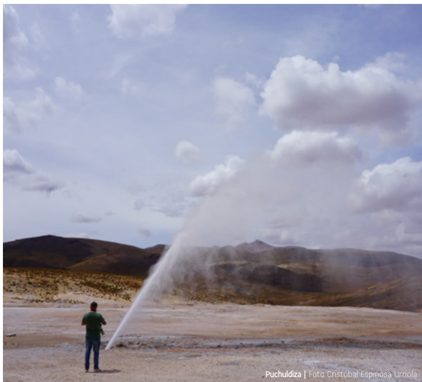
Puchuldiza | Foto Cristóbal Espinosa Urriola