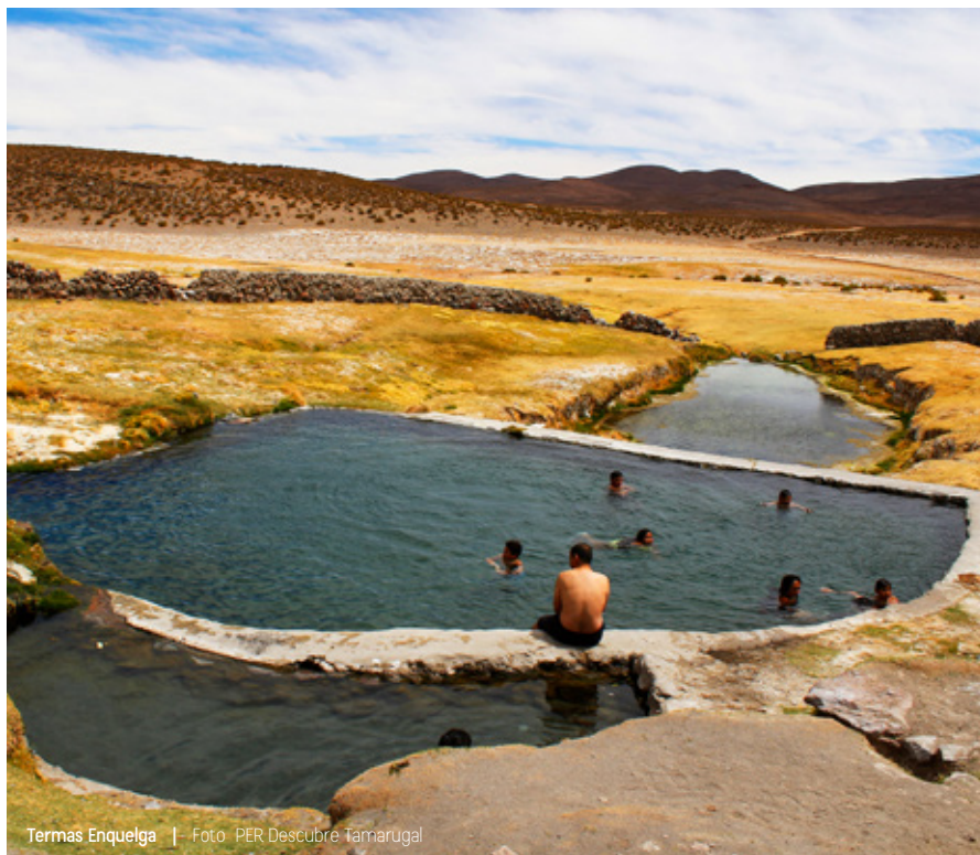
Termas Enquelga