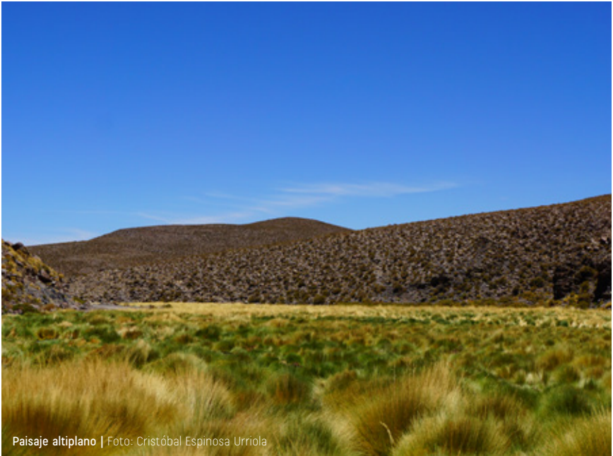
Paisaje altiplano